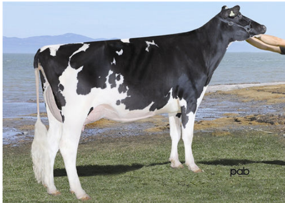
WABASH-WAY-I SHOTTLE EMBER THIRD DAM