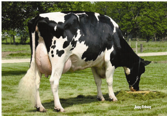
CROCKETT-ACRES MTOT ELLY FIFTH DAM